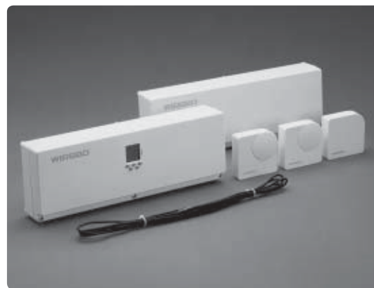
Uponor CoSy elektronisk rumsreglering